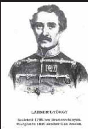
LAHNER GYÖRGY Szállított 1795-ben Beateerechányán. Kivégzték 1849 október 6-án Aradon.

hasonló sikerrel lehetetlen lett volna más által betölteni. E három ember: Lahner tábornok, Lukács honvédezeredés és Duschek Ferenc.”