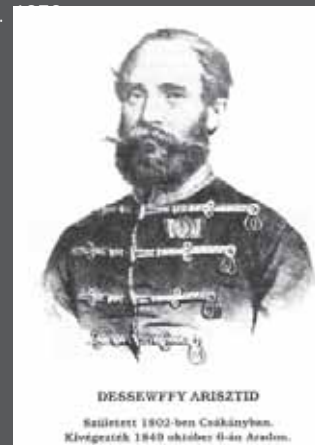
DESSEWFFY ARISZTID Szállított 1802-ben Csákványban. Kivégzték 1849 október 6-án Aradon.

(Balo Béni református lelkész visszaemlékezése.) Katona Tamás: Az aradi vértanúk.