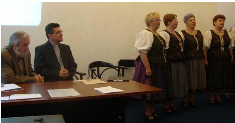
Az Árvalányhaj énekesei két népdalcsokrot adtak elő a bemutatkozáson