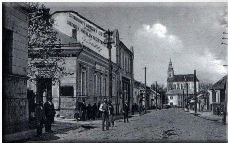
Királyhelmeccen a 30-as években

A céheknek 1870-ben történt megszüntetésével nem szűnt meg a helybeli iparosság szervezeti élete. Igaz viszont, hogy ipartársulati életet csak a csizmadia-cipészek éltek,