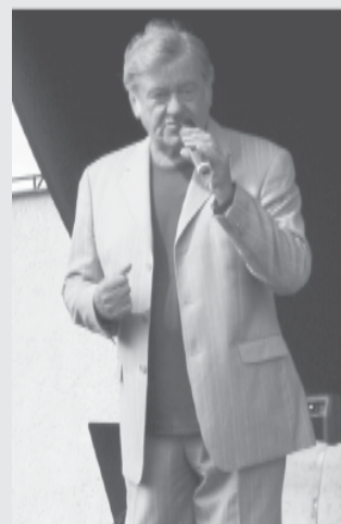
Koós János ismert slágereivel, humoros történeteivel szórakoztatta a közönséget