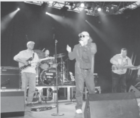
Charlie - a koncertje közben