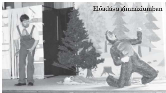
Előadás a gimnáziumban

Fontosnak tartom megemlíteni az esemény támogatóit: Guido Signorinit és a GMP céget, valamint Dudás