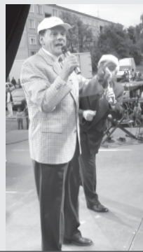
A Mikroszkóp Színpad tagjainak előadása